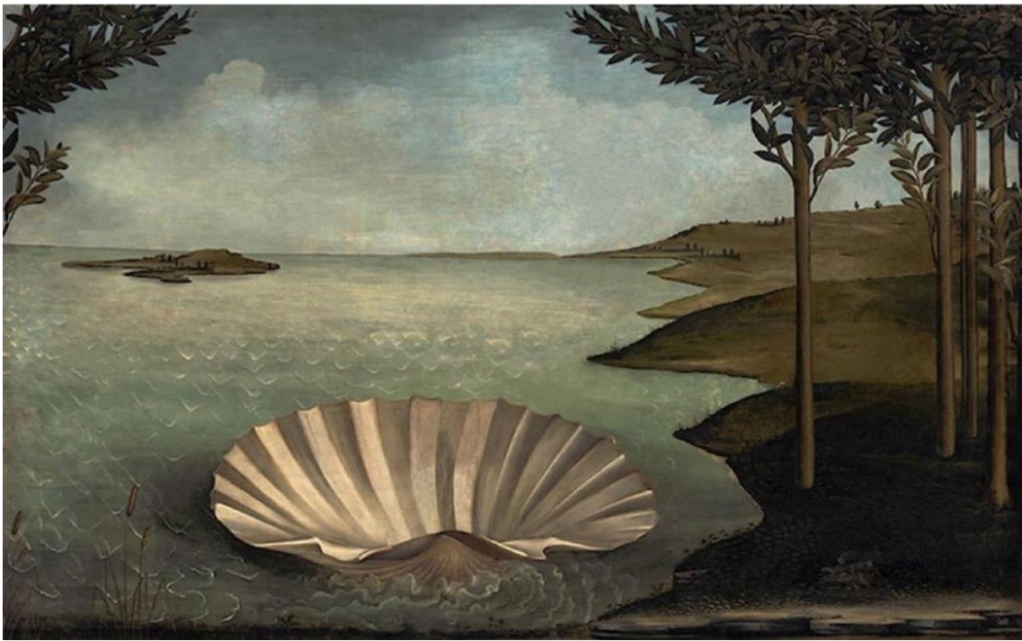
"El nacimiento de Venus " (Boticelli, 1482)